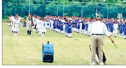
जीद। स्वतंत्रता दिवस को लेकर पीटी करते बच्चे।