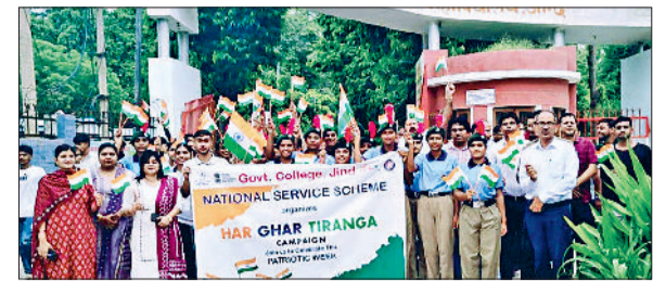
जीद। तिरंगा यात्रा निकालते हुए।