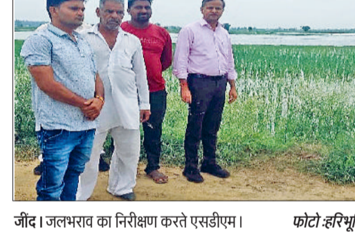
जीद। बैठक में भाग लेते पाषंड।