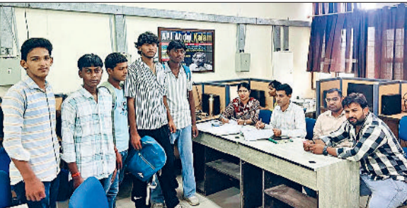
जीद। दाखिले के लिए पूछाछ के लिए आए छात्र।

औद्योगिक प्रशिक्षण संस्थान (आईटीआई) में दाखिले के लिए चौथी मेरिट लिस्ट के बाद खाली बची सीटों पर पांचवें चरण के तहत निर्धारित अंतिम तिथि अब 31 अगस्त तक कर दी है। अब तक पंजीकरण नहीं करवाने वाले किसान पंजीकरण करवा सकते हैं।