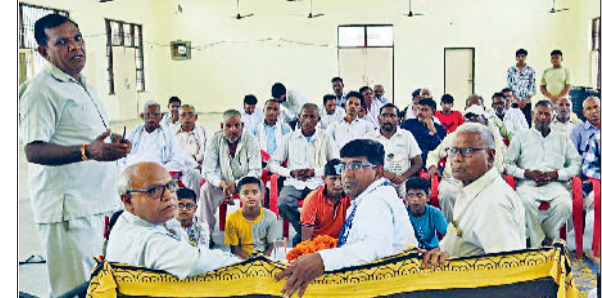
जीद। बैठक में भाग लेते कार्यकर्ता।