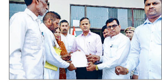
जुलाना। मजदूर एसडीएम को मांगों का ज्ञापन सौंपते हुए।