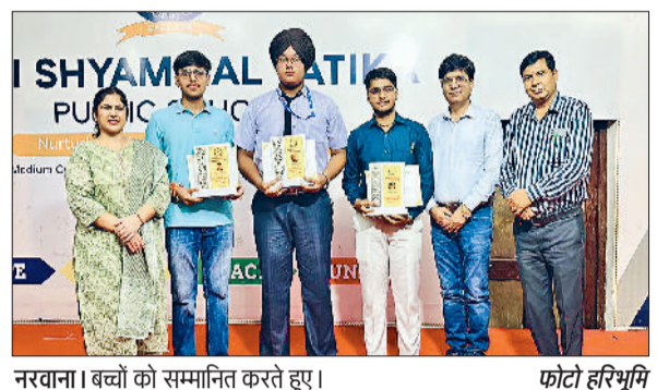
जीद। बच्चों को सम्मानित करते हुए।

का प्रतीक है। प्रत्येक नागरिक का कर्तव्य है कि वह इसका सम्मान करे और देश की प्रगति एवं सद्भाव में अपना योगदान दे। यह यात्रा महाविद्यालय के इस संकल्प को दर्शाती है कि वह युवाओं में राष्ट्रीय गौरव और जिम्मेदारी की भावना जागृत करने के लिए निरंतर प्रयासरत रहेगा।