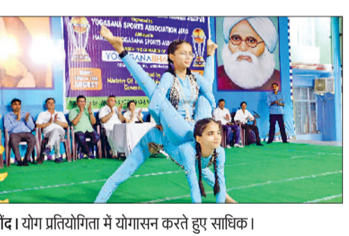
जीद। योग प्रतियोगिता में योगासन करते हुए साधक।