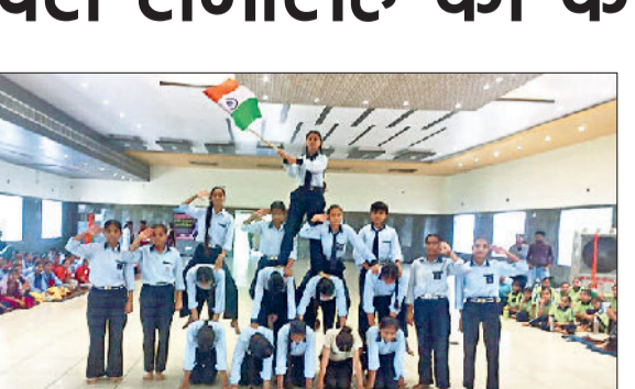
गुहला-चीका। उपमंडल स्तरीय स्वतंत्रता दिवस समारोह की तैयारियां करते विद्यार्थी।