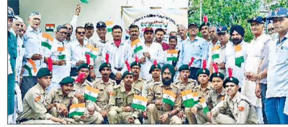
कैथल। तिरंगा अभियान के दौरान पूर्व सैनिक और एनसीसी कैडेट्स।